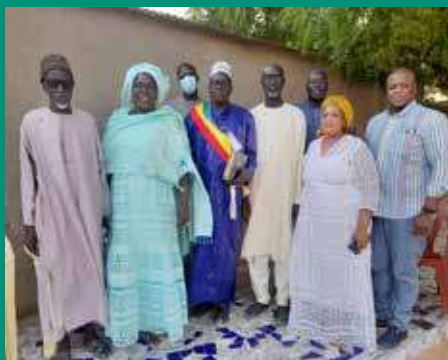
Chez le Chef de quartier de Ndorong