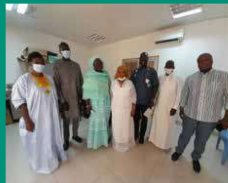
dans les locaux de l'action sociale