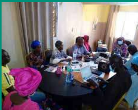
Avec les médiateurs