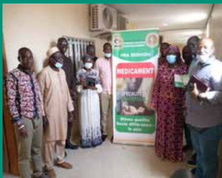
A la pharmacie régionale d'approvisionnement