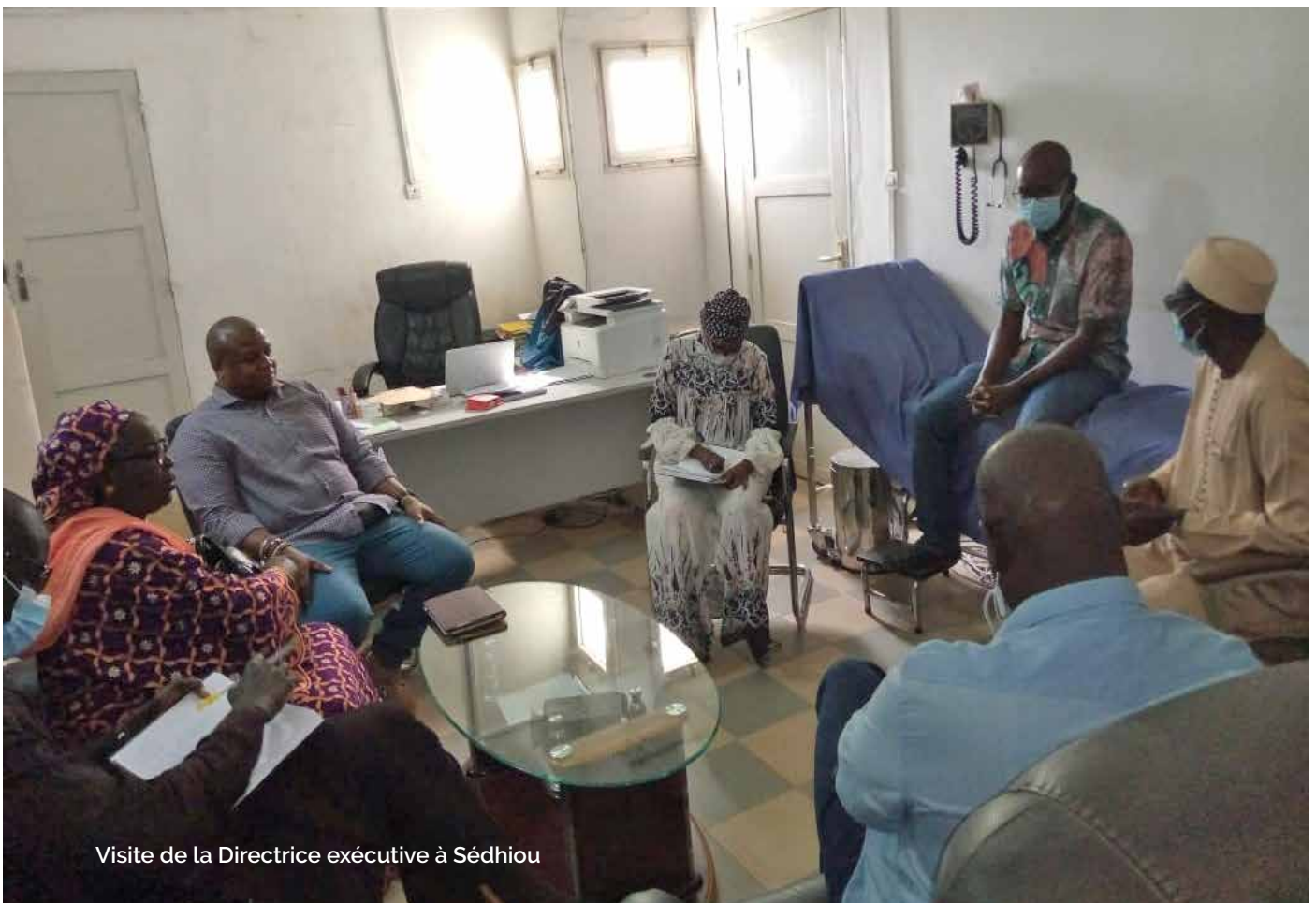
Visite de la Directrice exécutive à Sédhiou