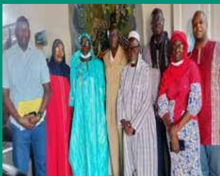
Chez le Gouverneur