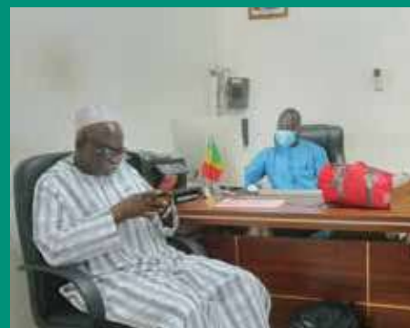
A la pharmacie régionale d'approvisionnement