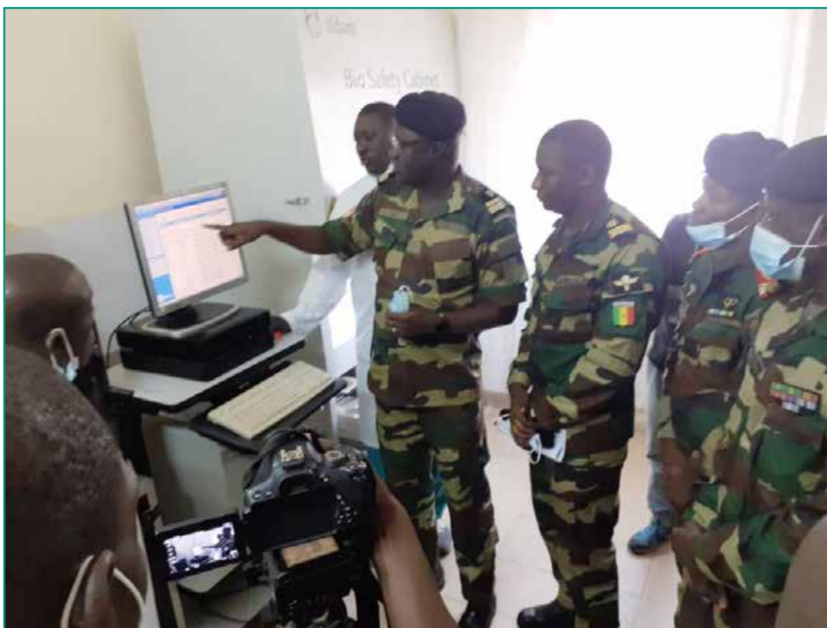
Lancement de l'unité de mesure de la charge virale à Ziguinchor