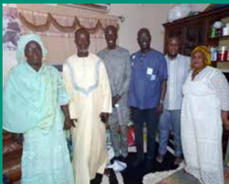
Chez le marabout de Touba Ndorong