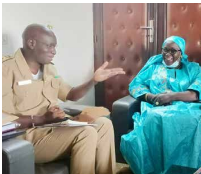
Visite de la Directrice exécutive chez le Gouverneur de Louga

De ce fait, la stratégie des cliniques communautaires (implantées à Kaolack, à Louga et à