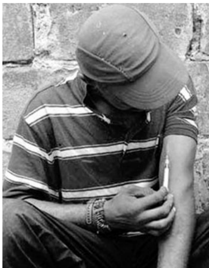
Consommateur de drogue injectable (CDI)

Les juges d'application des peines peuvent donc contribuer décisivement, dans le cadre de l'aménagement des peines, à une meilleure prise en charge des détenus addicts à la consommation de drogues.