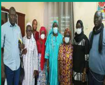
Chez le médevin chef du district