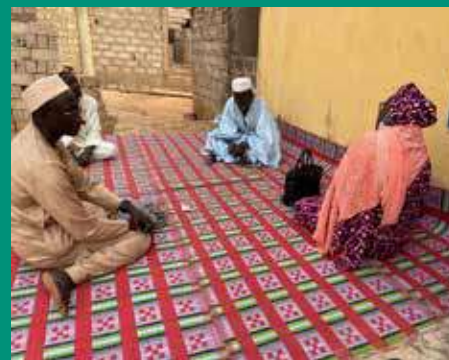
Chez l'imam râtib